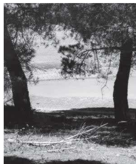
Arriba, vista de los pinares de El Maderal. Sobre estas líneas izquierda, laguna de Belliscas y a la derecha, iglesia de El Maderal